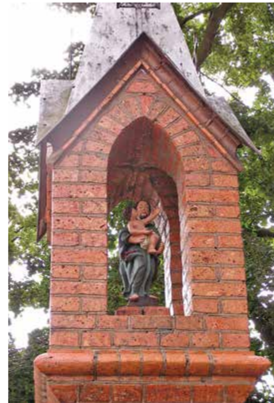
Kapliczka św. Józefa w Pszczewie

W krajobrazie Pszczewskiego Parku Krajobrazowego dominują lasy i jeziora. Wśród łąk i pól położone są niewielkie miejscowości, w których spotkać można wiele zabytków. Jednym z bardziej charakterystycznych elementów małej architektury są przydrożne kapliczki i figury. Mniej lub bardziej okazałe, z bogatą historią lub takie, o których niewiele wiemy - jednak wszystkie stanowią nieodłączny element wiejskiego krajobrazu Parku.