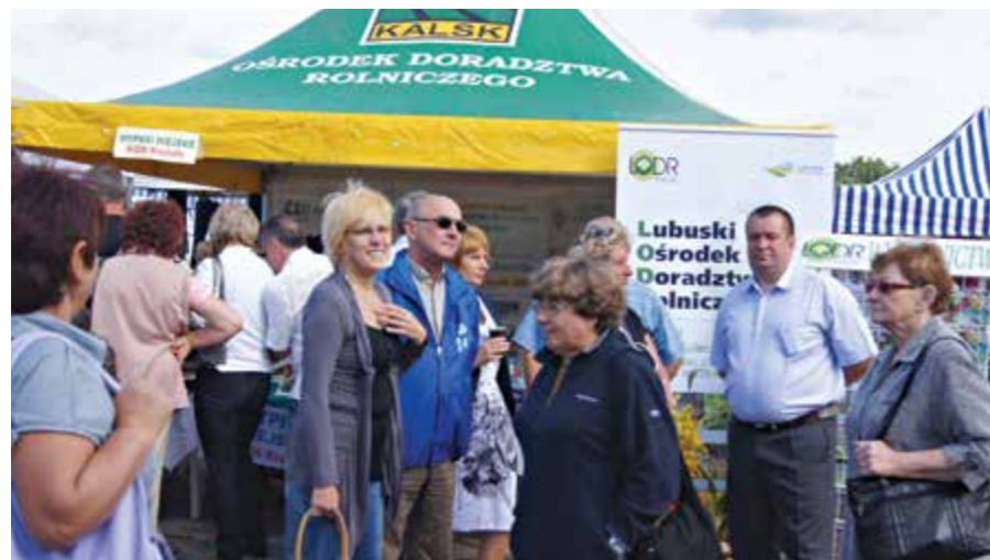
Piknik zbożowy, Zielona Góra 2011 r.

Odnoszę wrażenie, że mówi to Pan ze smutkiem? Zgadza się?