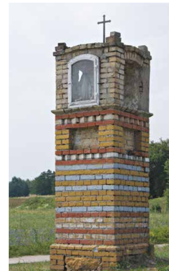
Kapliczka w Stoulniu