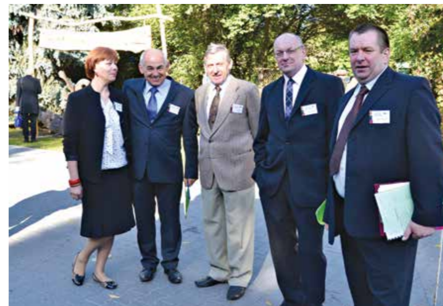
Targi Jesienne Kalsk 2012 r.

Siłą rzeczy tak jest. W moim przypadku jest to podyktowane tym, że od