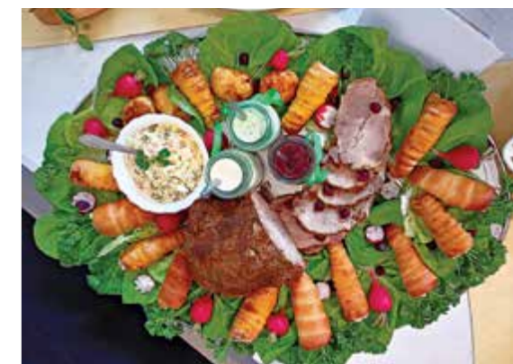
I miejsce: Zamiast zająca, za to z marchewkami