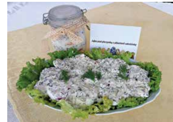
III miejsce: Jajka pod pierzynką z pikanterii odrobinką