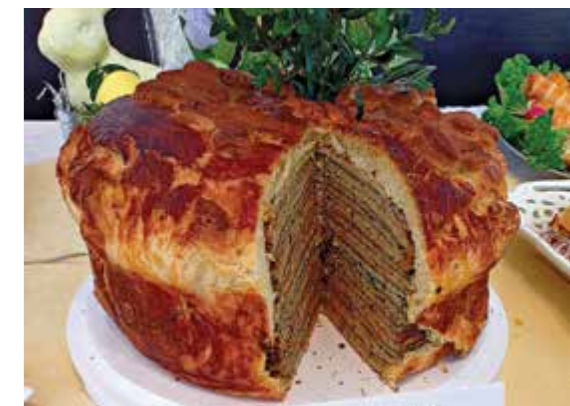
II miejsce: Wielkanocna baba wytrawna